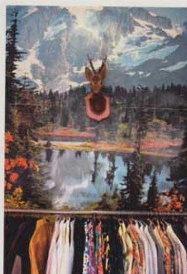
Klang und Kleid