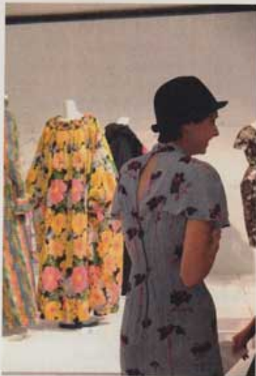
Musée du textile