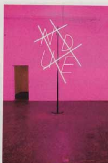
Kunst Halle im Lagerhaus

dans la capitale de l'Ostschweiz, classée au patrimoine de l'Unesco. L'arty s'y défend. Notamment au sein de sa Kunst Halle installée dans l'immense bâtiment du Lagerhaus , au bout de la Davidstrasse. Ces anciens entrepôts, bâtiments de briques du début du XX e , accueillent galeries, ateliers, bibliothèque, etc. Sur le chemin, on aura traversé le flamboyant Stadtlounge , un espace public investi par deux artistes, Pipilotti Rist et Carlos Martinez, en 2005 et qui nous met dans le rouge, au sens propre. Pour s'en remettre, une halte s'impose, pourquoi pas à la