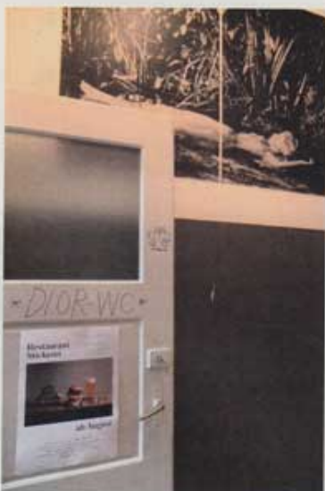
Les WC de Stickerei par Beni Bischof