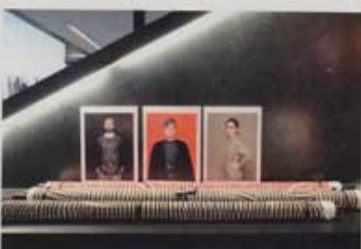
Bambola, la boutique Jakob Schlaepfer