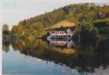
Les bains Jugendstil à Dreilinden

puisque même les restaurants, les plus anciens du moins, y tiennent leurs salles qu'on atteint par des escaliers grinçants et étroits comme celui du Wirtschaft zur alten Post . Dans cette maison du XVI e siècle, on peut goûter à la traditionnelle St. Galler Bratwurst mit Zwiebel-sauce und knuspriger Rösti, une saucisse de veau garnie d'une sauce aux oignons confits et ses croustillants röstis. Mais il n'y a pas que l'historique qui vibre