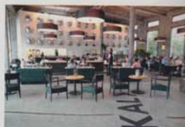
Le Lokal et l'œuvre de J. Armleder

La cité couchée entre deux collines doit aussi sa renommée mondiale à ses broderies et dentelles, une industrie textile haut de gamme qui a assis sa prospérité, comme en témoignent son Musée du textile et le créateur Jakob Schlaepfer , pourvoyeur en étoffes précieuses de la planète haute couture. Saint-Gall est riche et cela se voit d'autant plus si on lève les yeux. Là-haut, les oriels, ces fenêtres en encorbellement qui s'extraient des façades à colombages, sont légion dans le centre historique qui en compte 111. Un record! Restons à l'étage, un lieu prisé des Saint-Gallois,